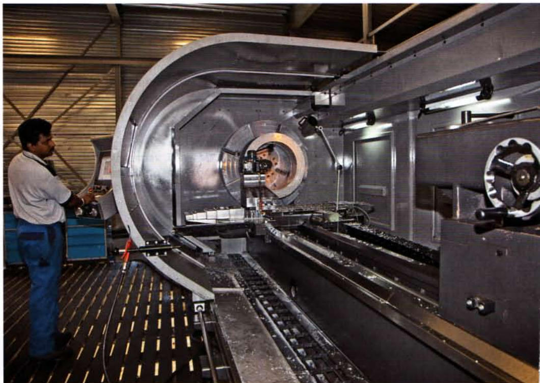
● Het machinepark van de machinefabriek is zeer geavanceerd en up-to-date.

Begin dit jaar is de Machinefabriek Dekens in Sappemeer van start gegaan. Een nieuwe productielocatie die is uitgerust met een modern machinepark en het personeelsbestand bestaat uit een tiental vakbekwame medewerkers. De fabriek behoort evenals het gerenommeerde zusterbedrijf Gieterij Borcherts, ook in Sappemeer gevestigd, tot de Dekens Groep en beide locaties zijn op een steenworp afstand van elkaar verwijderd.