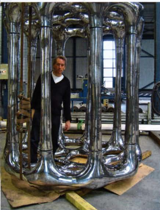
● Aluminium kunstwerk van Hans Muller, hoogglans gepolijst met een gewicht van 1500 kilo. Het kunstwerk bevindt zich in het Deventer Ziekenhuis.

De Machinefabriek Dekens is bij uitstek geëquipeerd om complexe opdrachten uit te voeren, bijvoorbeeld moeilijk te verspanen producten en materiaalsoorten.